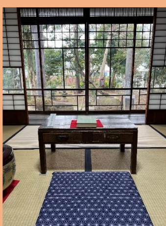
漱石の目線②内坪井旧居

にしたためていたのかもしれませんが。漱石の私生活を垣間見た後は、教師としての漱石が活躍した場を見てみましょう。五高の建物は記念館となっており、熊本大学の敷地内にあります。内坪井旧居からは徒歩で30分かかりますが、途中子飼商店街を通れば、昭和レトロな雰囲気を楽しむこともできます。バスで行く場合は、熊本大学前で下車してくださいね。熊本大学北キャンパスの赤門から入